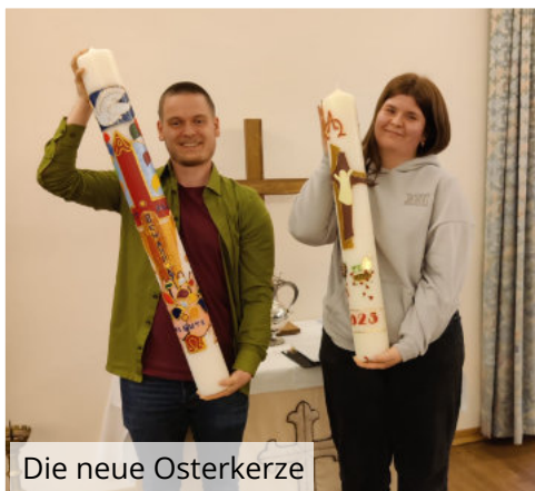
Die neue Osterkerze